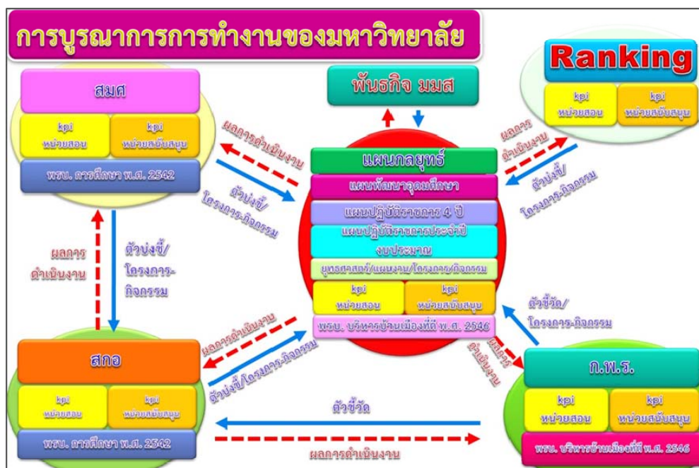
แผนภาพ 1 แสดงความเชื่อมโยงและการบูรณาการการจัดทำแผนยุทธศาสตร์มหาวิทยาลัย

ด้วยพระราชกฤษฎีกา ว่าด้วยการหลักเกณฑ์การบริหารจัดการบ้านเมืองที่ดี พ.ศ. 2546 หมวด 3 ในมาตรา 14 ได้กำหนดให้ส่วนราชการต้องจัดทำแผน 4 ปี ดังนั้น มหาวิทยาลัยจึงได้ปรับแผนกลยุทธ์มหาวิทยาลัยมหาสารคาม (พ.ศ. 2558–2561) เพื่อให้มหาวิทยาลัยมีแผนแม่บทระยะยาวที่เป็นกรอบแนวทางที่แสดงถึงยุทธศาสตร์ รวมถึงกลยุทธ์ต่างๆ เพื่อพัฒนามหาวิทยาลัยมหาสารคามให้สอดคล้องกับความต้องการของประเทศ ชุมชน และท้องถิ่น สามารถชี้นำและเป็นกลไกกำกับติดตามการดำเนินงานให้มีขีดความสามารถในเชิงการแข่งขันโดยเน้นการพึ่งตนเอง โดยมหาวิทยาลัยได้มีการบูรณาการภารกิจของมหาวิทยาลัย ทั้ง 4 ด้าน มาตรฐานการอุดมศึกษา กรอบมาตรฐานคุณวุฒิระดับอุดมศึกษาแห่งชาติ (TQF) และมาตรฐานการจัดอันดับการศึกษาระดับนานาชาติ ภายใต้ 7 ยุทธศาสตร์ คือ 1) การผลิตบัณฑิตที่มีคุณภาพภายใต้การจัดการเรียนการสอนในหลักสูตรที่ทันสมัยตามเกณฑ์คุณภาพและมาตรฐานของชาติและสากล รวมทั้งมีความพร้อมเข้าสู่ประชาคมอาเซียนและประชาคมโลก 2) การวิจัยเพื่อสร้างองค์ความรู้และพัฒนานวัตกรรมที่สร้างมูลค่าเพิ่มหรือใช้ประโยชน์ให้กับชุมชนและสังคม 3) เป็นศูนย์กลางแห่งการเรียนรู้และบริการวิชาการแก่สังคมในภาคตะวันออกเฉียงเหนือ 4) ส่งเสริมการนำทุนทางวัฒนธรรม ขนบธรรมเนียม และภูมิปัญญาท้องถิ่นไปใช้ประโยชน์อย่างยั่งยืน และผสมผสานวัฒนธรรมในระดับชาติและสากล 5) พัฒนาระบบบริหารจัดการให้มีประสิทธิภาพ และยกระดับการบริหารจัดการมหาวิทยาลัยตามหลักธรรมาภิบาล 6) ส่งเสริมภาพลักษณ์ของมหาวิทยาลัยให้ได้รับการยอมรับและพัฒนาเป็นมหาวิทยาลัยในระดับสากล และ 7) พัฒนาสู่มหาวิทยาลัยสีเขียวและรักษาสິงแวดล้อม