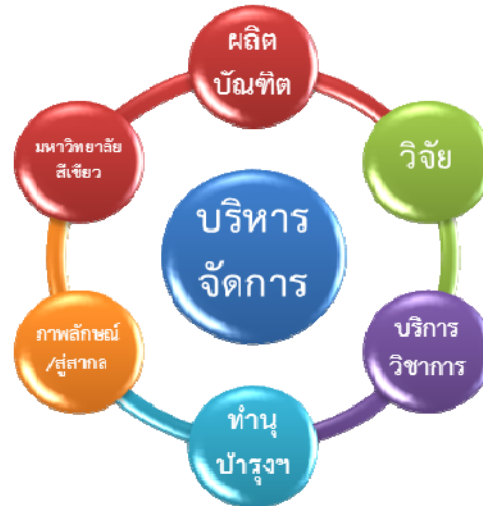
แผนภาพ 2 กรอบการประเมินผลการปฏิบัติราชการของคณะ/หน่วยงาน

ทั้งนี้ โดยมหาวิทยาลัยมุ่งหวังว่า แผนกลยุทธ์มหาวิทยาลัยมหาสารคาม (พ.ศ. 2558–2561) จะเป็นแผนแม่บทระยะยาวที่สอดคล้องกับนโยบายของรัฐบาล และเป็นกรอบแนวทางที่แสดงถึงประเด็นยุทธศาสตร์ ยุทธศาสตร์ รวมถึงกลยุทธ์ต่างๆ เพื่อการพัฒนามหาวิทยาลัยมหาสารคามให้สอดคล้องกับความต้องการของประเทศ ชุมชนและท้องถิ่น สามารถชี้แนะและเป็นกลไกให้มีขีดความสามารถในการแข่งขันเน้นการพึ่งตนเอง และคาดหวังว่าคู่มือการประเมินผลแผนกลยุทธ์มหาวิทยาลัยมหาสารคามจะช่วยสร้างความเข้าใจเกี่ยวกับแนวทางการปฏิบัติและการประเมินเพื่อพัฒนามหาวิทยาลัยให้บรรลุเป้าหมายและวิสัยทัศน์ที่กำหนด